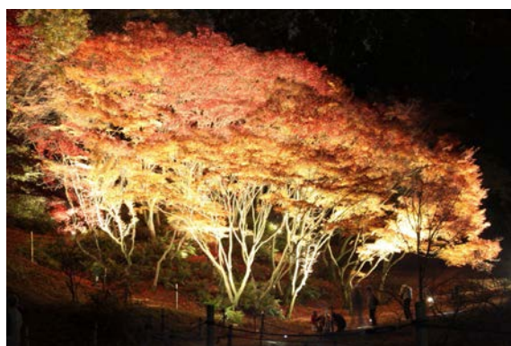
昨年のライトアップ風景

昨年に引き続き、今秋も見頃を迎えるカエデ山の紅葉のライトアップの実施が決定しました。園内にあるカエデ山には、紅葉の代表種である「イロハモミジ」をはじめ、「ハウチワカエデ」などの品種を中心に約50種類を収集しています。葉が赤や黄に色づくこの時期に、カエデ山をメインに幻想的な情景をお楽しみいただけます。昼間と違った夜の植物園を、是非ご覧ください。多くの御来場をお待ちしています。